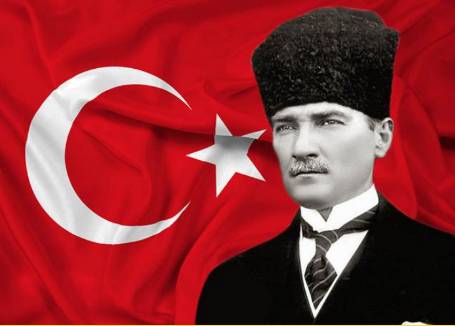
Mustafa Kemal ATATÜRK